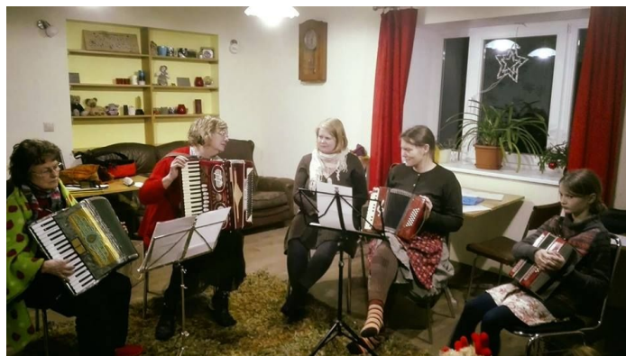
Pilliharjutuste algus Anseküla Seltsimajas.

29. jaanuar 2018 - Pillide tutvustus. Proovime mängida (mõni lausa esimest korda elus) akordioni ja väikekannelt.