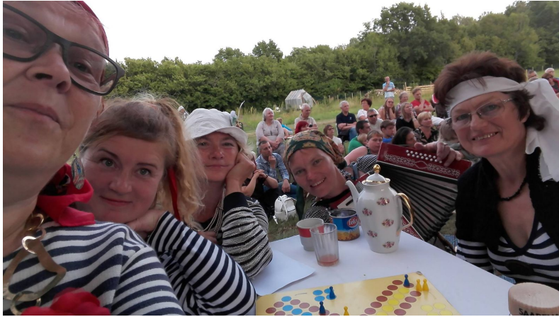
Ammuker ja Uljad Neitsid Ansekülas.

15. juuli 2018 - Ansekülas etendusel "Uljas neitsi" esinemine. A. Kivirähk, Salme vallateater ja Maire Sillavee.