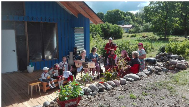
Ammuker ja pillimängijad Maarika pool avatud kohvikute päeval

2. juuli 2018 - Ansekülas vanade meremehelaulude salvestus.