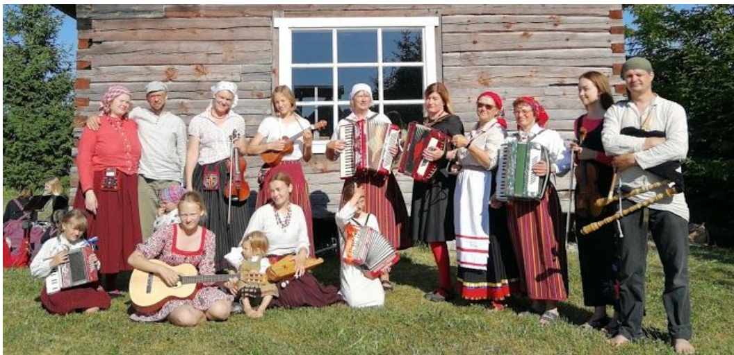
Sörvema Sörmitsejad Jööris.

https://www.meiemaa.ee/index.php?content=artiklid&sub=1&artid=82164