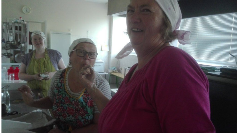
Pannileivataigna mekkimine.

21 mai 2018 - Külas Maiel, kus toimus Ammukeri lauluproov.