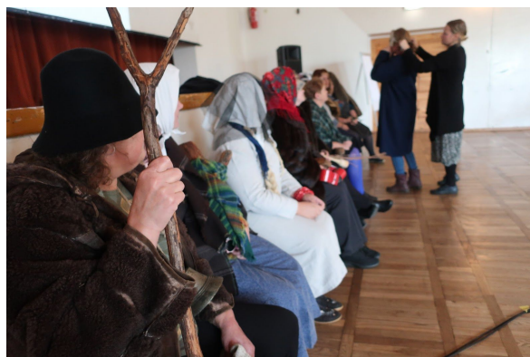
Salme mudilaskoor mängib "Aadamal oli 7 poega" ja santimiskoolitus Sandla rahvamajas. Pildistas Mari 2020