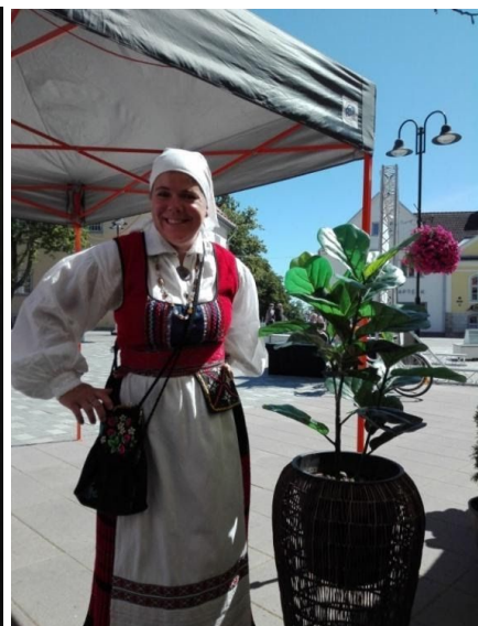
Ettevalmistused esinemiseks Kuressaares linna keskväljakul juunis 2020