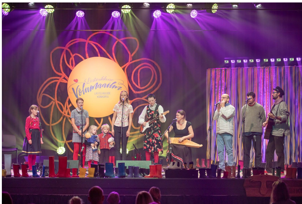
Ülesastumine Mooste Folgikoja laval, pärimusringi lapsed ja Küi. 2020

13. oktoober, Anseküla seltsimajas koos Salme mudilaskoori lastega, ringmängud ja mardipäevakombed