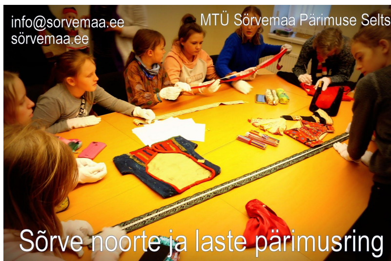
Sõrve noorte ja laste pärimusring Saaremaa muuseumi varakambreid külastamas. 2020