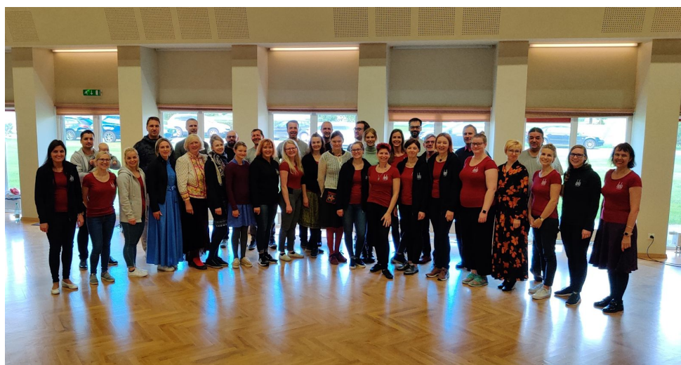
Tartu segakoor Helü ja Maakoor Salme rahvamajas peale ühiskontserti. Foto Helü FB lehelt 2020

13. september, ühiskontsert koos kooriga Helü Salme rahvamajas