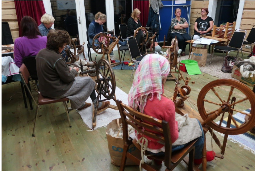
Esimine ülalistung. Okkijaid on tuba täis! Pildistas Mari 2020

28. september - esimene ülalistung "Me akam okkima". Tuletame meelde vanu oskuseid