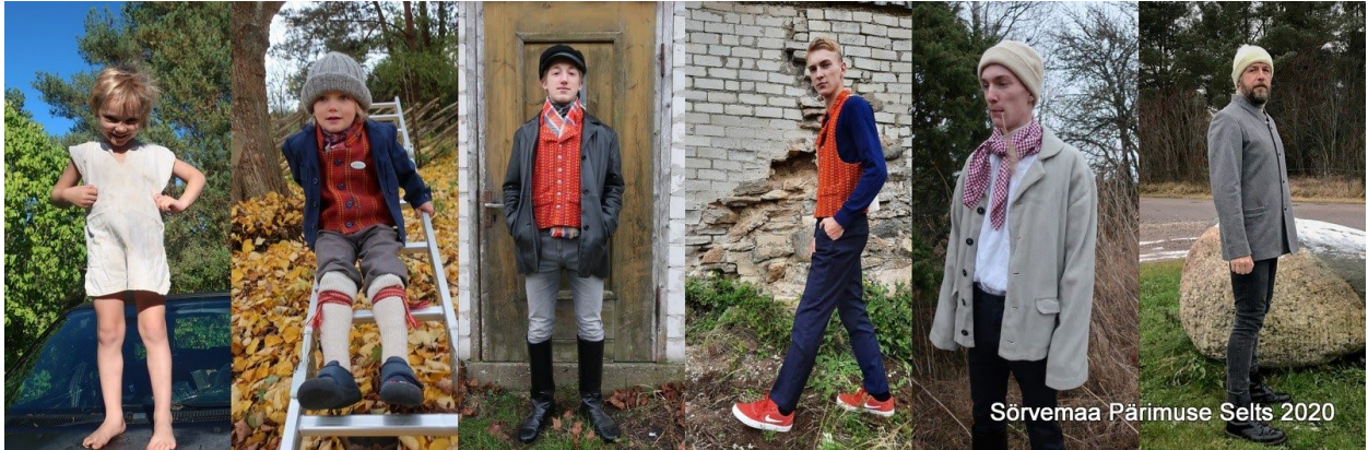
Sõrve meesteriided Sõrve isaste garderoobis.

Nüüd on valmis kõiki Sõrve riideid tutvustavad artiklid koos suure hulga illustreeriva materjaliga (kokkuvõte: https://sõrvemaa.ee/sps/sorve-rahva-riided/ ). Jääb vaid oodata, kuni kõik ka meie võrgulehel nähtavad on, ning siis saame koos noortega välja mõelda, mida vahvat neist materjalidest edaspidi veel kokku panna annaks!