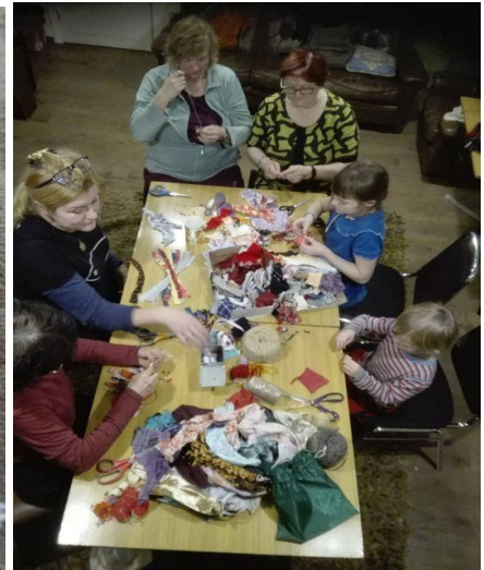
Värvililne pilutikand ning tutitegu. Pildistas Mari 2020

9. märts - oleme laulmas Kihelkonnal Säase Manni pool