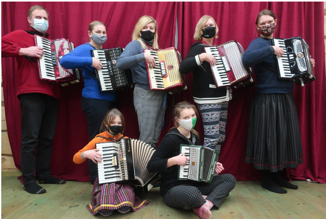
Möödunud aastat kirjeldab vast kõige paremini hoopiski jaanuaris 2021 tehtud foto Sõrvemaa Sõrmitsejate akordionirühmast. Pildistas Mari 2021

https://sõrvemaa.ee/sps/seltsi-ettevotmised/ . Tegevusi kajastab jooksvalt ka meie FB lehekülg.