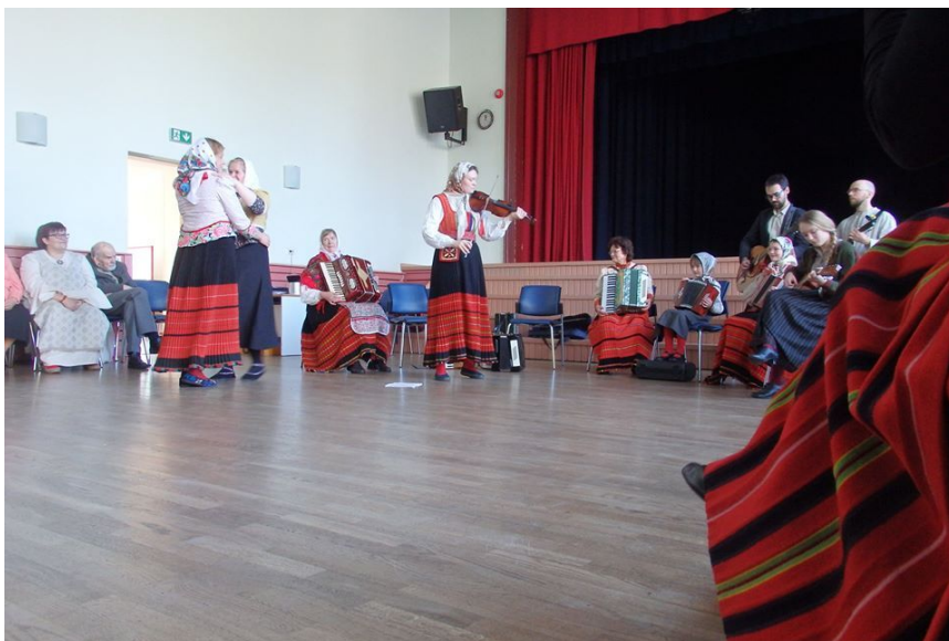
Keskpäevane kohtumine Hiiumaal.

2. november. Rahvamuusikapäev Pärssamal. Akordionimängijad.