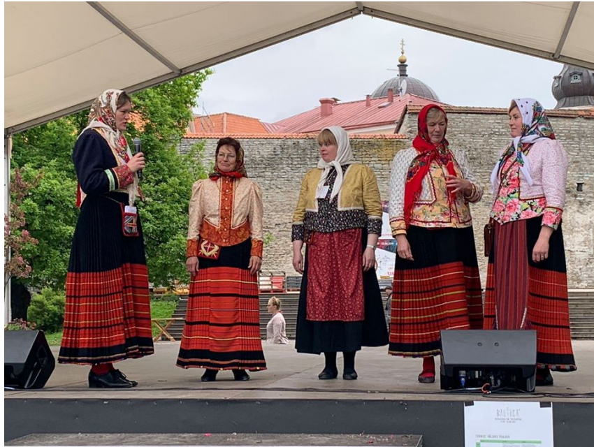
Jökkide tutvustamine Baltical Tallinnas.