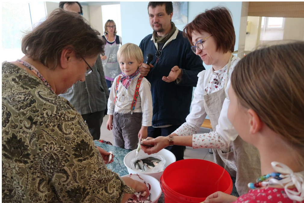
Kultuuriruumi rikkuse pidu lidel.

Kõik seltsi olulisemad ettevõtmised oleme koondanud võrgulehele https://sõrvemaa.ee/sps/seltsi-ettevotmised/ . Lehekülg sai pikk ja lai, aga ometigi pole sealtoodu veel kaugeltki kõik.