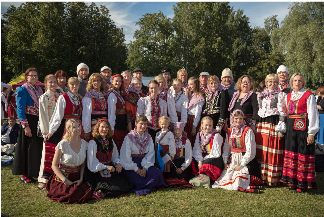
Sõrve Maakoor Laulupeol 2020.