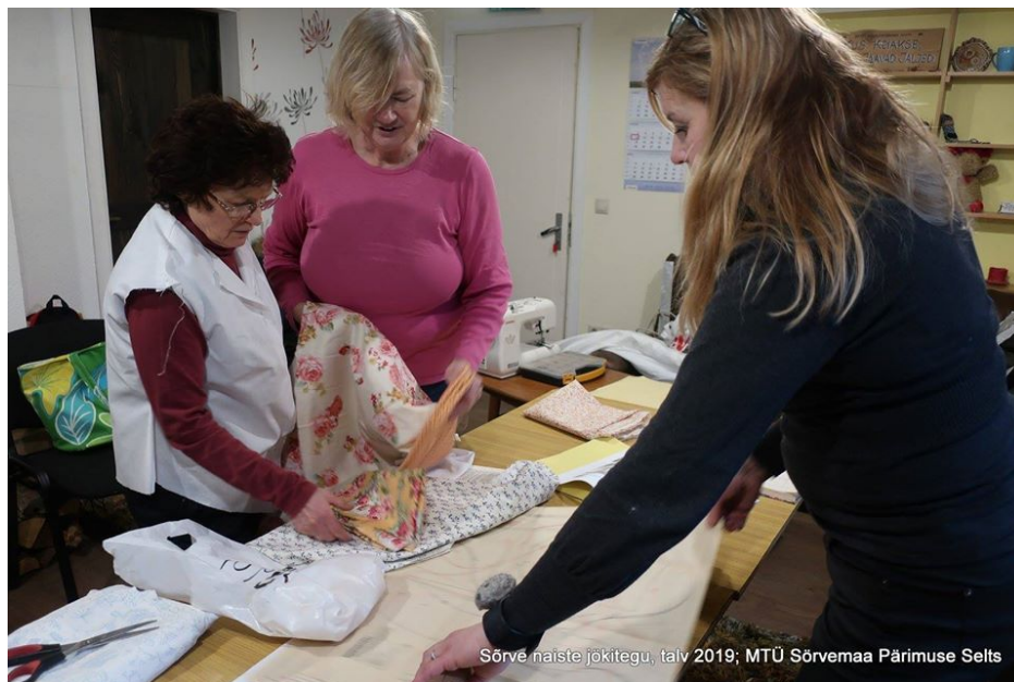
Jõkiomblemine talvel 2019.

Pätitegu https://xn--srvemaa-90a.ee/uncategorized/sorulaste-patitegu/