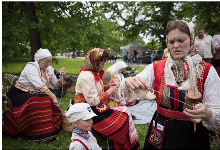
Ketramise õpituba Baltical.

17. nov Muhulaste Ätsed ning sõrulaste Ammuker kohtusid 17. novembril 2019 Taritu rahvamajas. Laulsime, tantsisime ja tutvustasime üksteisele oma kodukandi toitusid.