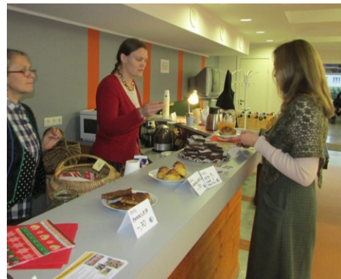
Joonis 1 Käsitöö-öö Saku Suurhallis Mardilaadal. Ammuker. 11. november 2016. ja Ammuker Jõululaadal 2016 Salme Rahvamajas

7. august 2016 – Rahvariiete tuulutuspäev Loomesuvila õuel