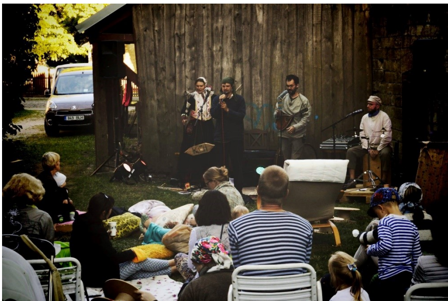
Joonis 3 KÜI Loomesuvilas 2016.

4.08.2016 – KÜI Jõekontsert koos Jaan Pehkiga