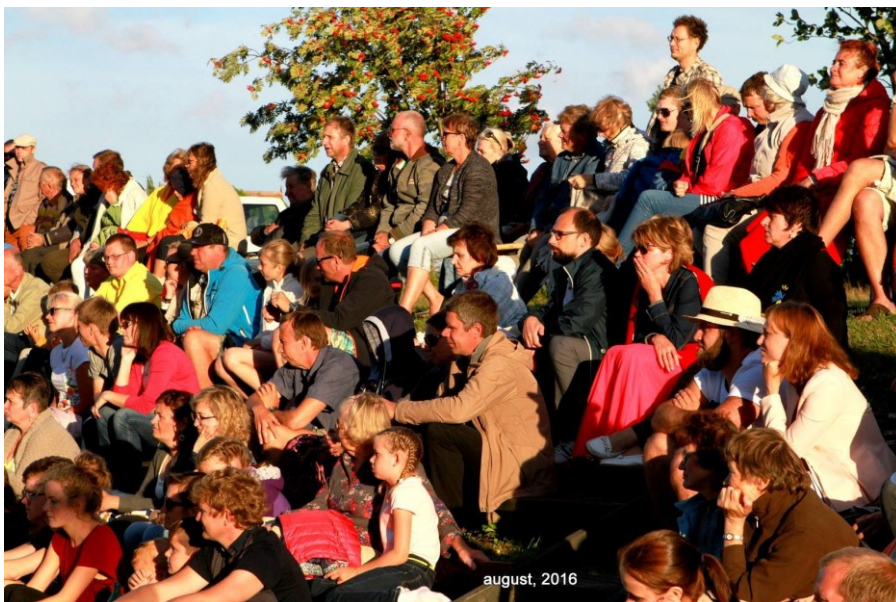
Joonis 4 KÜI publik Jõekontserdil.

19.02.2016 – Salme Rahvamaja juubelipidustustel esinemine